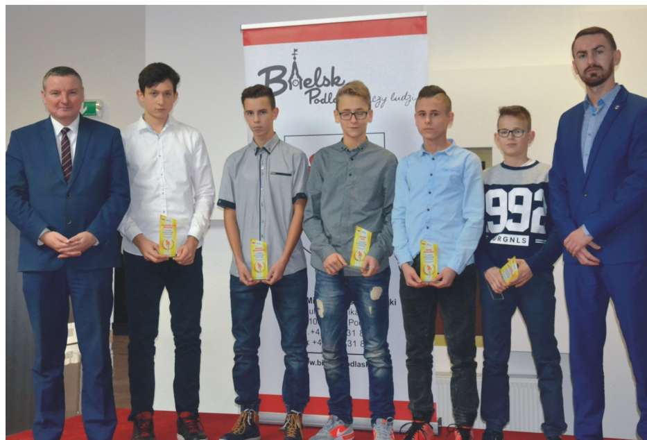
Nagrodzeni sportowcy otrzymywali nagrody z rąk burmistrza.

Burmistrz przyznał nagrody finansowe za osiągnięcie wysokiego wyniku sportowego drużynie piłki koszykowej chłopców z Gimnazjum nr 1, która zajęła II miej-