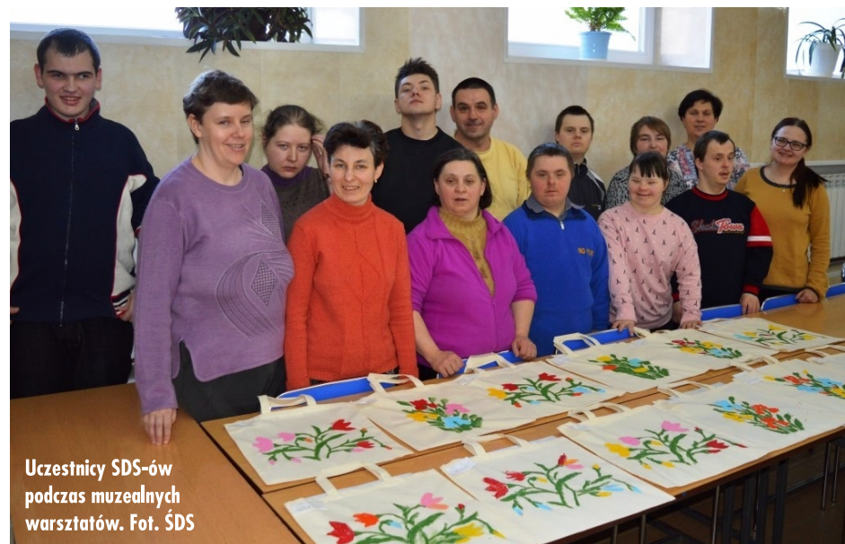
Uczestnicy ŚDS-ów podczas muzealnych warsztatów.

wane”. Zajęcia odbyły się dzięki współpracy z Muzeum w Bielsku Podlaskim. Warsztaty inspirowane były rękodzielnictwem ludowym, w którego katalogowaniu specjalizuje się Bielskie Muzeum. Na gości z ŚDS-u czekały już przygotowane bawelniane torby i farby do tkanin. Przewodnym motywem malowanym przez uczestników zajęć były kwiaty – w ten sposób nawiązano do zbliżającego się Dnia Kobiet. (ŚDS)