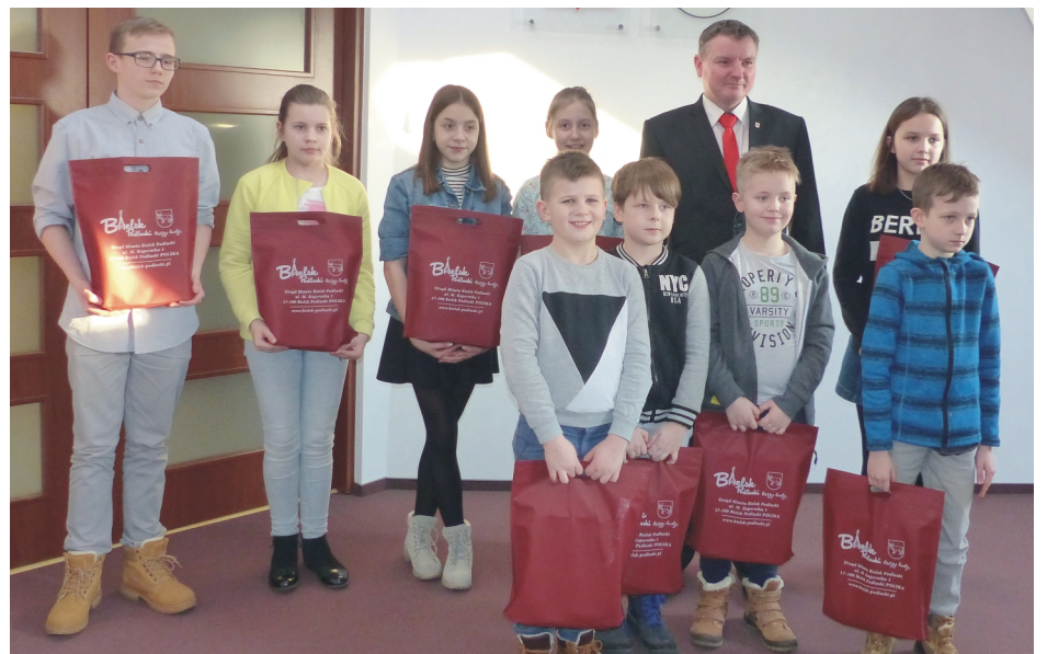
Młodzi fotograficy podczas spotkania z burmistrzem.