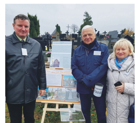
W tegorocznej zbiórce publicznej organizatorów wspomagało wielu wolontariuszy, w tym bielscy samorządowcy.

Zebrań kwota zostanie przeznaczona na kolejne działania z zakresu renowacji zabytkowych nagrobków na bielskich cmentarzach. Najprawdopodobniej będą to: kamienny pomnik z grobu Augustyna Lwowicza Taranowicza (17.02.1836 –