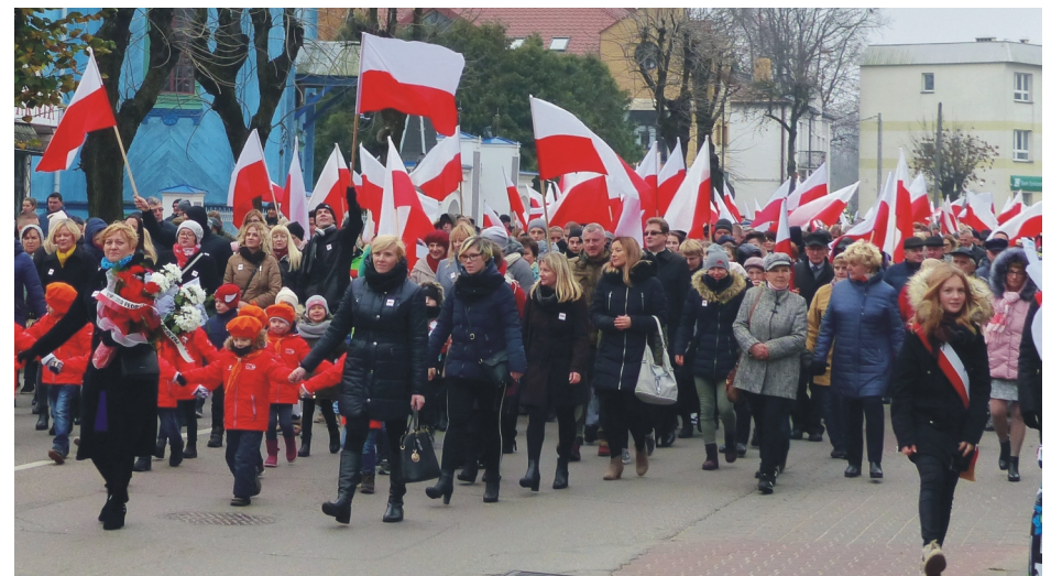
Bielski Marsz Niepodległości na ulicach miasta.

Później w Parku Królowej Heleny rozpoczął się Piknik dla Niepodległej przygotowany przez Bielski Dom Kultury. W je-