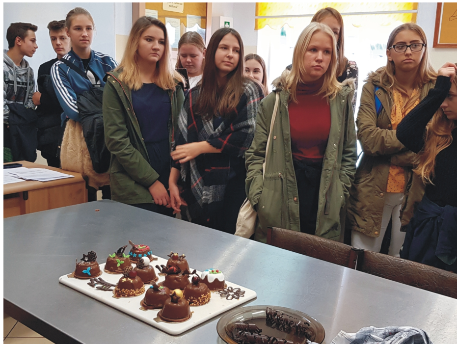
Uczestnicy projektu podczas wizyty w jednej z bielskich firm.

Wizyta w Arhelanie rozpoczęła się od wprowadzenia teoretycznego w sali konferencyjnej, gdzie szczegółowo zostały przedstawione dane na temat przedsiębiorstwa, powstawania nowych sklepów, zapotrzebowania personalnego oraz ścieżki kariery zawodowej. Następnie grupa miała okazję zwiedzić magazyn