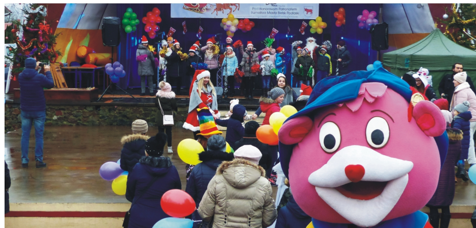
Festyn Mikołajkowy SDS-u zachęcił bielszczan do wspólnej zabawy w amfiteatrze miejskim.