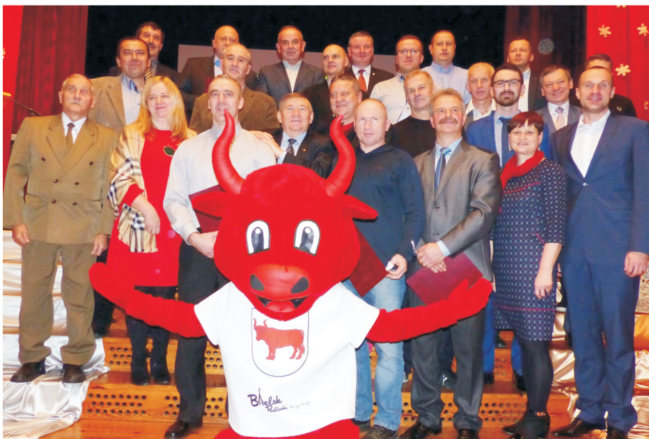
Nauczyciele, trenerzy i działacze, których wychowankowie zdobywali laury i zostali wyróżnieni.

Doroczne nagrody i wyróżnienia za osiągnięte wyniki sportowe oraz osiągnięcia w działalności sportowej w roku 2017 wręczył Burmistrz Miasta Bielsk Podlaski.