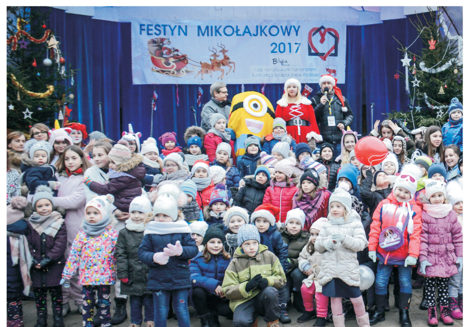
Dzieci wesoło bawiły się na Festynie Mikołajkowym.

przez Bielski Dom Kultury jarmark bożonarodzeniowy. Na stoiskach znalazły się ozdoby choinkowe, stroiki i kartki świąteczne, choinki, zabawki ręcznie szyte, piękne obrazy, wypieki, słodkości. Wśród wystawców obecni byli wystawcy z białoruskiego Kobrynia – miasta partnerskiego Bielska Podlaskiego, z oryginalnym rękodziełem artystycznym, a także: Bielskie Stowarzyszenie Uniwersytet Trzeciego Wieku, Stowarzyszenie „Małe Marzenia”, Stowarzyszenie „Ojcowizna Ziemi Bielskiej”, Warsztaty Terapii Zajęciowej, Zespół Szkół Specjalnych – Rada Rodziców, Pracownia artystyczna „Anielskie Pomyśły”, Firma Something Sweet z wypiekami oraz indywidualni wystawcy z Bielska Podlaskiego i Białegostoku. (jan)