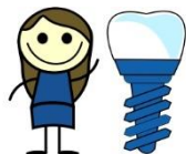
IMPLANTY SZYTE NA MIARĘ

Implant to wszczep - ciało obce wszczepiane do organizmu w celu odtworzenia naturalnej funkcji lub estetyki uszkodzonego organu. Najczęściej stosowane są implanty zastępujące tkanki twarde. Szeroko stosowane są implanty zastępujące kość lub stawy. Implanty stosowane są również u zwierząt. Na zajęciach słuchacze dowiedzą się co to jest implant i jak go wykonać na miarę. Jak do tego celu wykorzystywane są nowoczesne technologie typu tomografia komputerowa, skanowanie 3D oraz druk 3D.