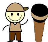
DZIENNIKARSTWO RADIOWE W PRAKTYCE

Uczestnicy zobaczą „od środka” jak wygląda radio. Dowiedzą się czy praca w radiu to naprawdę ciekawe zajęcie. Na czym polega praca dziennikarza radiowego i czy każdy może pracować w radiu? To tylko niektóre z pytań na które uczestnicy poszukają odpowiedzi w trakcie zajęć.