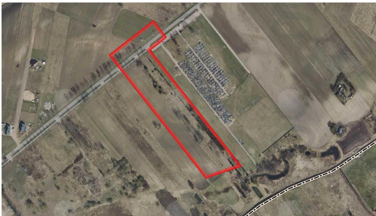
Rys. 2 Zasięg terenu opracowania

Biorąc pod uwagę podział fizyczno-geograficzny Polski, oparty na opracowaniu J. Kondrackiego, miasto zlokalizowane jest w mezoregionie Równina Bielska, będącego południowo-wschodnią częścią makroregionu Nizina Północnopodlaska, podprowincji Wysoczyzny Podlasko-Białoruskie, prowincji Niż Wschodniobałtycko-Białoruski, oraz megaregionu Niż Wschodnioeuropejski.